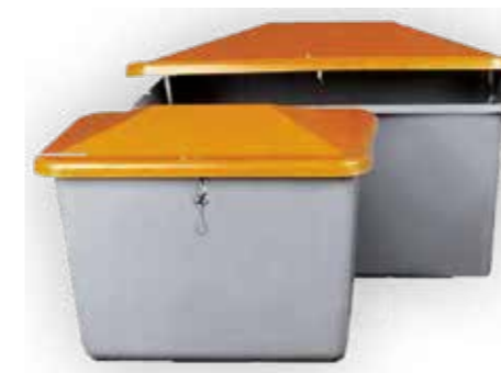
ZOUTBAK SUPERSTRONG Bac à sel extra forte Salt / grit bin super strong

* optioneel: slot optionnel: serrure optional: lock