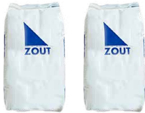
STROOIZOUT Sel de déneigement De-icing salt