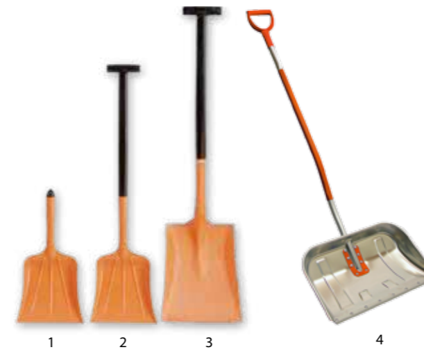
SNEEUWSCHOP Pelle à neige Snow shovel