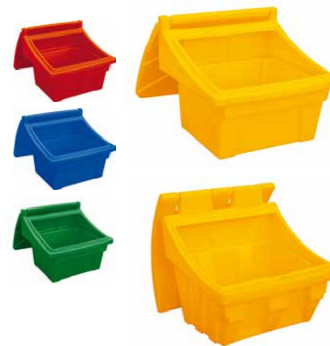
ZOUTBAK Bac à sel Salt / grit bin

Glasvezel versterkte kern in de steel Poignée renforcée par fibre de verre Reinforced glass fibre handle