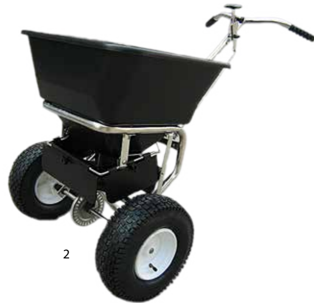
ZOUTSTROOIERS Ependeurs de sel Salt / grit dispenser

Luchtbanden / pneus pneumatique / pneumatic tyres