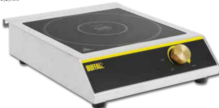
Table de cuisson en inox facile à nettoyer avec commande rotative simple, sécurité anti-surchauffe et arrêt automatique. Convient uniquement pour les batteries de cuisine induction, y compris les Vogue en acier inoxydable et triple épaisseur, ainsi que les Excellence et Tradition de Bourgeat en acier inoxydable jusqu'à 280(Ø)mm.