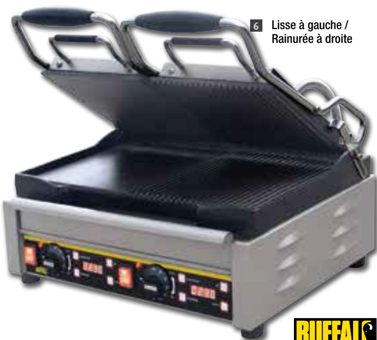
6 Lisse à gauche / Rainurée à droite