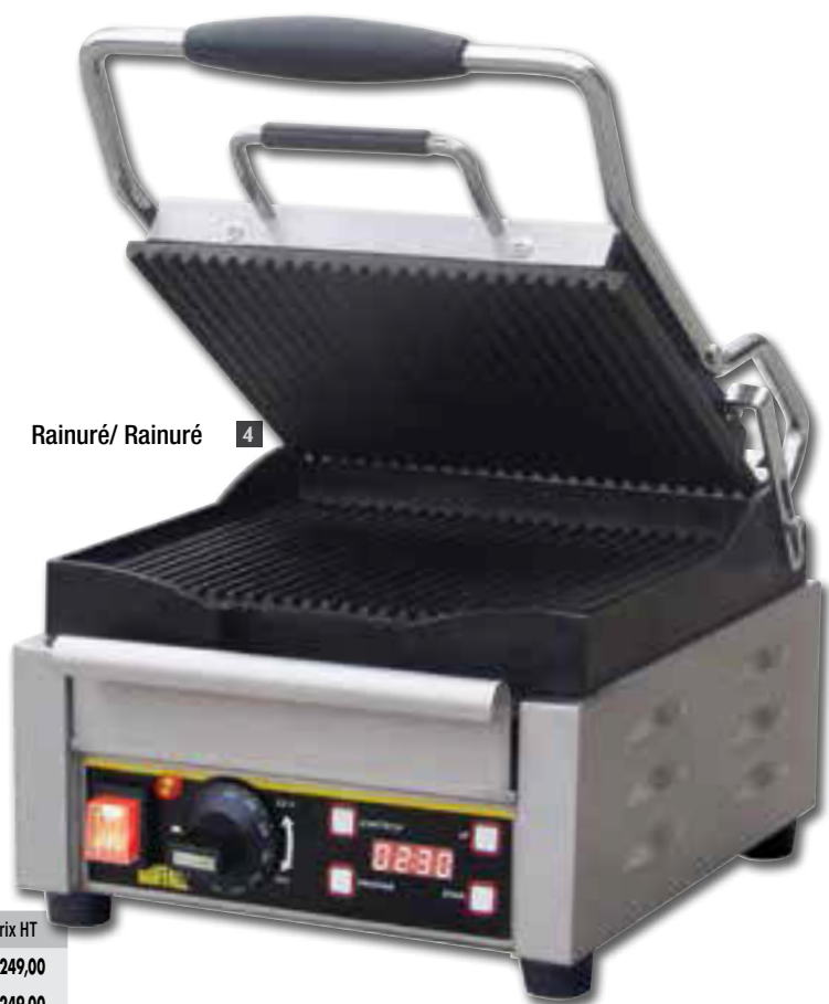
Rainuré/ Rainuré 4